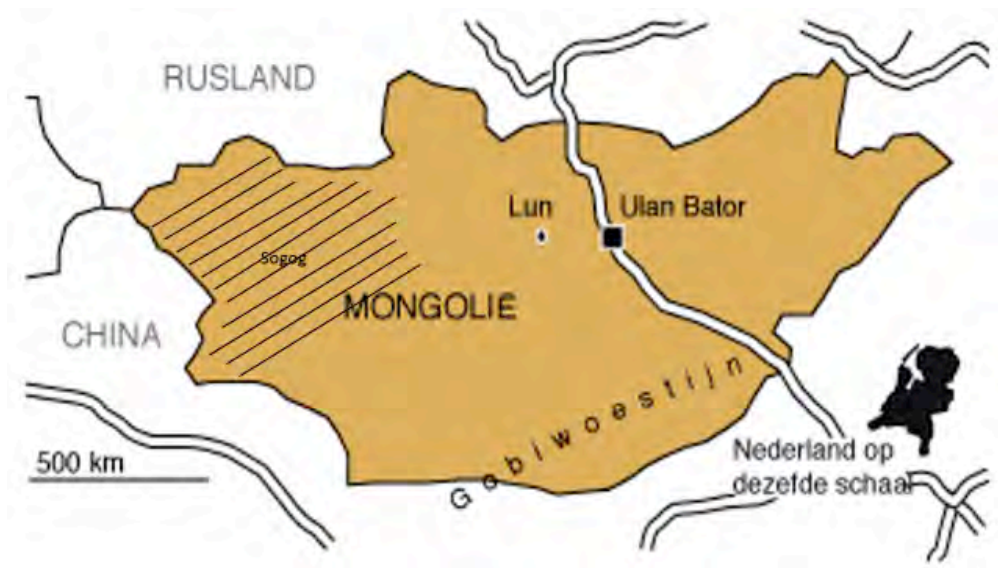
Aft. Werkgebied NGO Source of Steppe Nomads in West - Mongolië

In Mongolië is het aanspreekpunt (en samenwerkingspartner) voor de stichting de NGO Source of Steppe Nomads. Dit is een door de Mongoolse overheid erkende niet-gouvernementele organisatie (NGO) die ten doel heeft lokale initiatieven van en voor de nomadische herder bevolking in West-Mongolië te stimuleren en te begeleiden. Het bestuur van deze organisatie bestaat uit ca. 10 vertegenwoordigers uit de lokale bevolking. ( www.steppennomads.org )