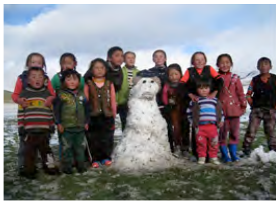
Ook de sneeuwpop keert jaarlijks terug