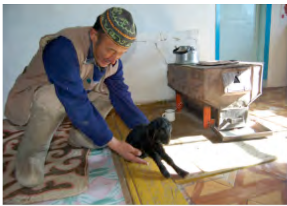
hun vee is zeer belangrijk, het is als familie

Stichting Vrienden van SSN is een Nederlandse organisatie die de Mongoolse NGO Source of Steppe Nomads ondersteunt bij het verbeteren van de levensomstandigheden van de steppenomaden en herders in Mongolië. De stichting Vrienden van SSN doet dit onder andere door het uitvoeren van projecten op het gebied van landbouw & milieu, voeding & gezondheid en onderwijs. Wij onderhouden de contacten met NGO Source of Steppe Nomads in Mongolië vanuit Nederland, werven en beheren fondsen voor de projecten in Mongolië, verzorgen de communicatie daarover in Nederland en adviseren en delen kennis ten behoeve van de activiteiten van de NGO Source of Steppe Nomads.