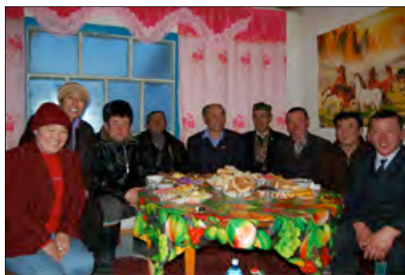
Het bestuur van Source of Steppe Nomads in 2008